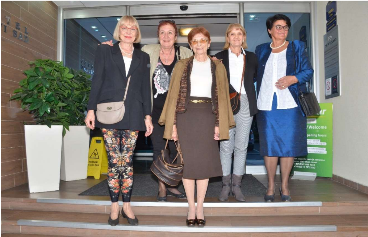
После 50 година заједно