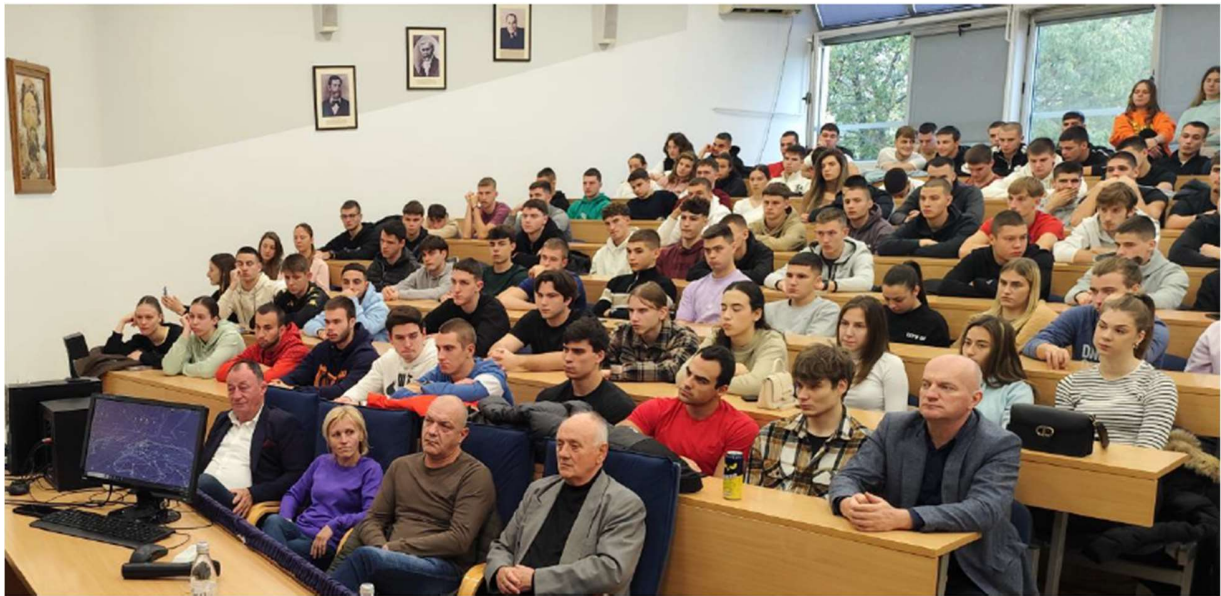
На Факултету спорта и у Средњој машинској школи