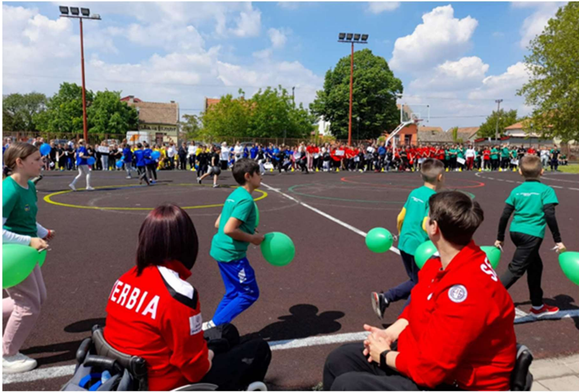
Равноправно спортисти и спортисти са инвалидитетом