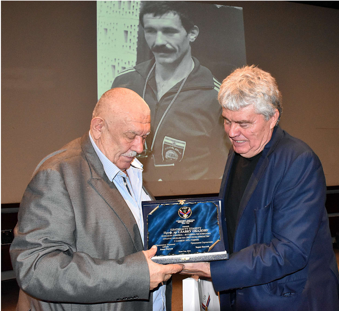
Не заборављамо великане