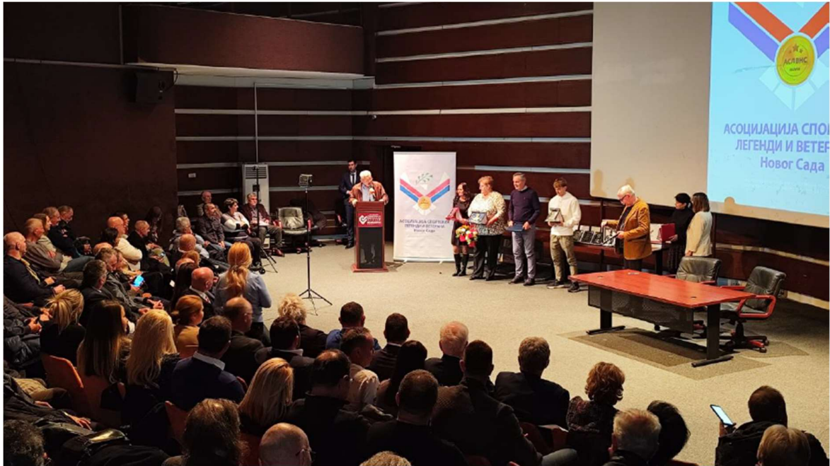
У славу спорта