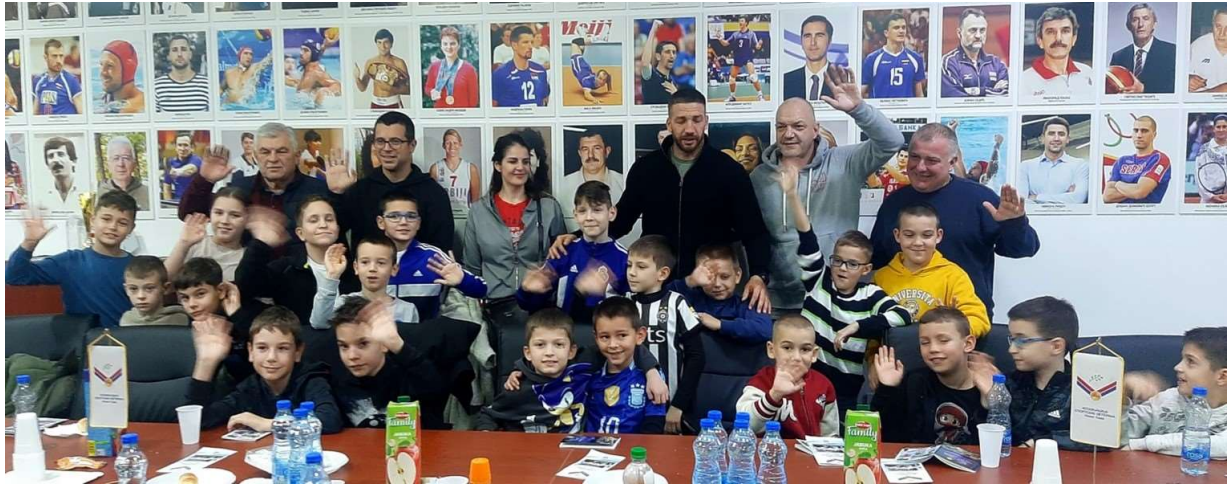
Олимпијске часове, воде препозантљиви великани, на које је дошло преко 5000 младих