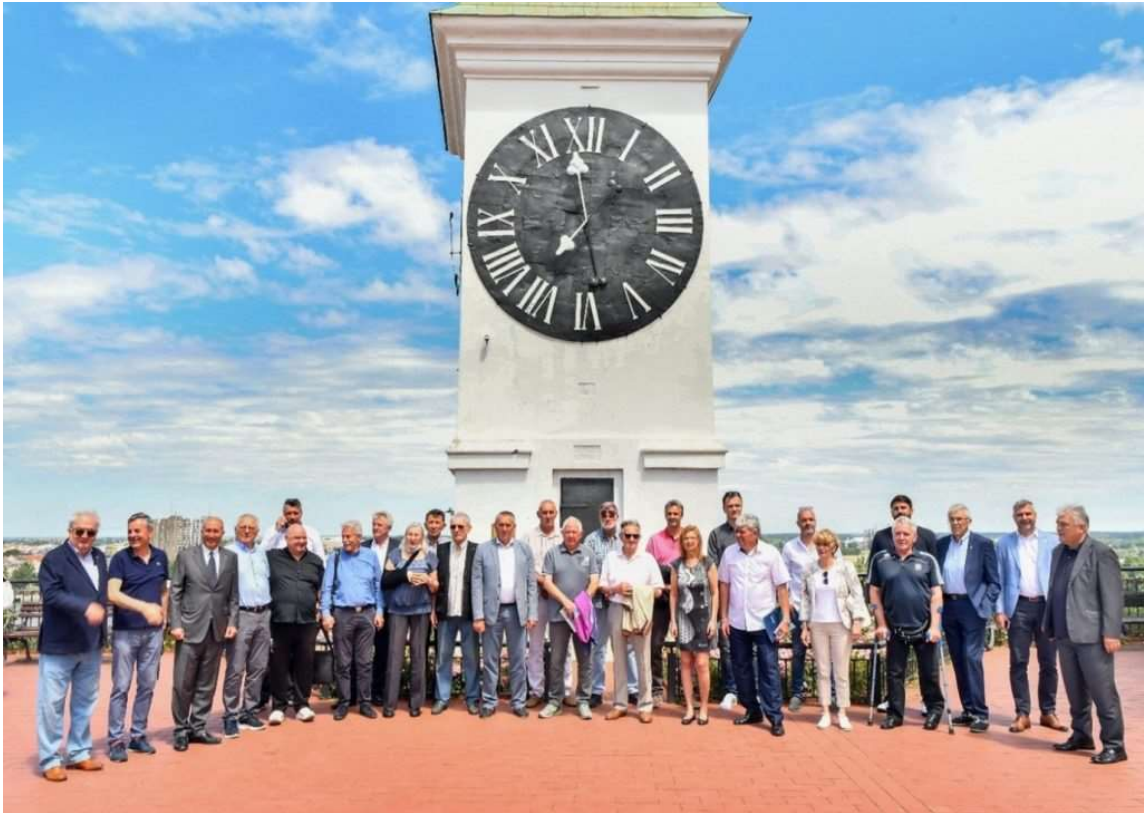
Промоције књига уз окупљање великана